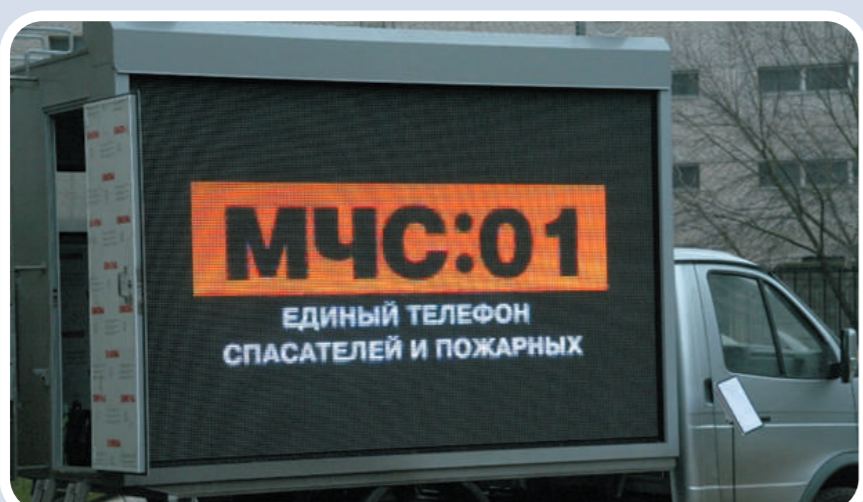
Мобильный комплекс информирования и оповещения населения