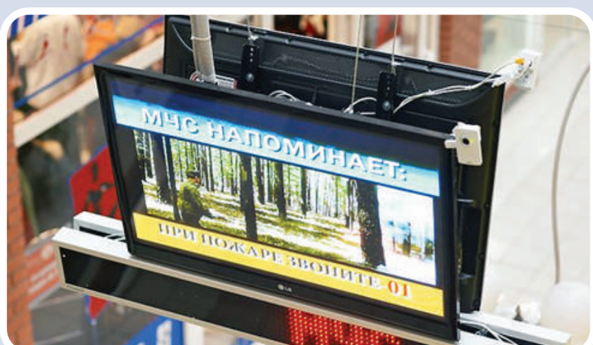
Пункт информирования и оповещения населения в зданиях с массовым пребыванием людей