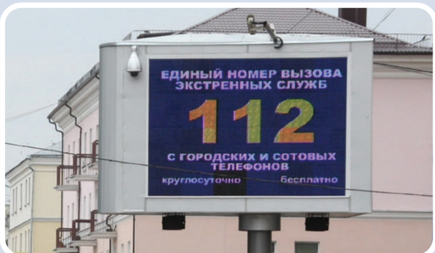
Пункт уличного информирования и оповещения населения